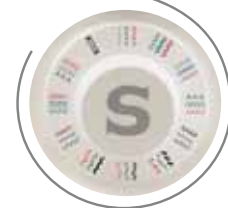
Facile selezione dei punti