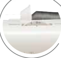
Regolazione ampiezza punto