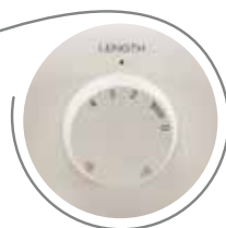
Regolazione lunghezza punto