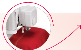
Pressione piedino regolabile