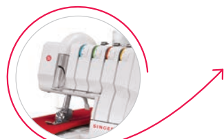
Regolazione manuale della tensione del filo