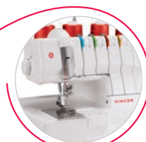
Infilatura facilitata con codici a colori

Accessori inclusi: cacciavite; 4 fermarocchetti; 4 retine anti srotolamento; cacciavite a brugola; pinzette; set aghi; pennellino; copertina morbida