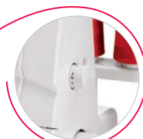
Regolazione lunghezza punto