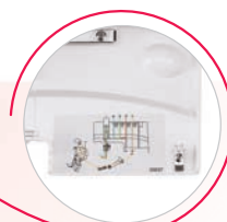
Crochet ad infilatura facilitata con codici a colori