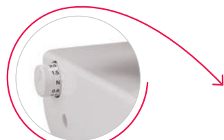
Regolazione trasporto differenziale