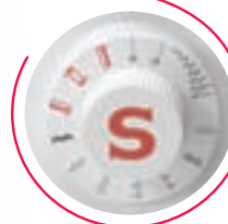
Facile selezione punti