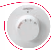
Regolazione lunghezza punto