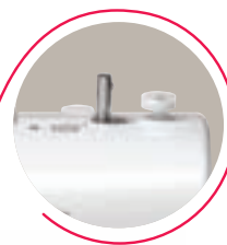
Avvolgi bobina automatico