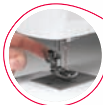
Piedini a sgancio rapido