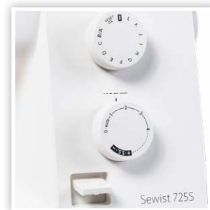
PRACTIQUES BOUTONS DE CONTRÔLE DES POINTS