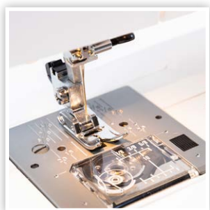
PLAQUE D'AIGUILLE BREVETÉE AVEC MARQUAGE