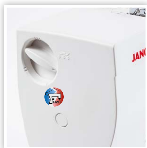
ACCÈS FACILE AU CADRAN DE PRESSION DU PIED