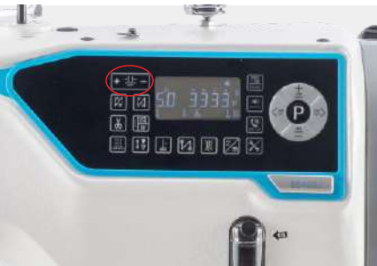
针距精准，稳定可靠