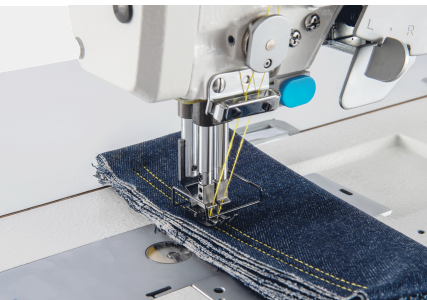
电子夹线，起缝线迹更美