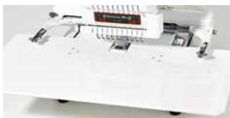
Table d'extension pour les très grands projets

L'accès simplifié à la canette vous fait gagner du temps. Vous pouvez changer la canette sans devoir retirer le cadre à broder.