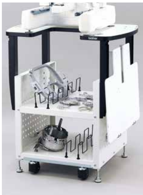
Table et rangement pour machines PR

Cette table mobile supporte solidement les machines de la gamme PR et offre un vaste espace de stockage et de rangement pour vos accessoires et vos fils.