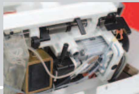
+ 10 années d'expérience avec le moteur de couture intégré dans la tête