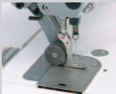
Puller avec pied standard ( fermé )

FRANCE GÉNÉRAL MACHINES À COUDRE Réparation • Vente • Achat • Location