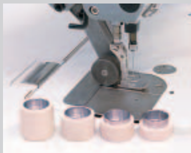
Changement simple sur différentes largeurs de puller