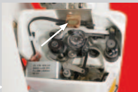
+ Contrôleur du fil de canette -926/06, avec détection du fil restant (en option)

Les tensions de fil sur ces machines sont extrêmement faibles. L'élévation de la barre à aiguille peut être modifiée de 30 à 36 mm, condition nécessaire à la mise en œuvre d'une gamme extrêmement vaste de matières.