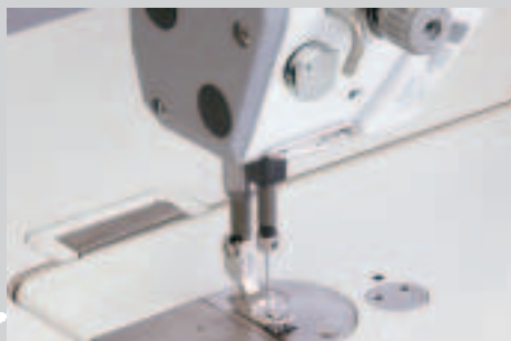
+ Le nouveau pince-fil -909/14, à commande électronique, est le garant d'un commencement toujours propre et net à l'endroit de l'ouvrage.