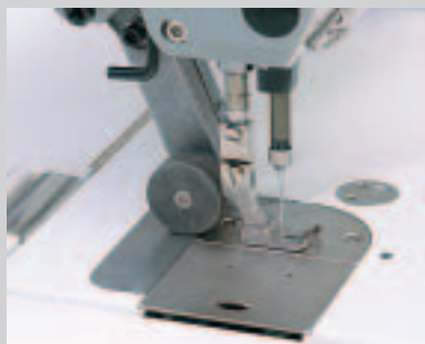
Puller avec pied et adaptateur