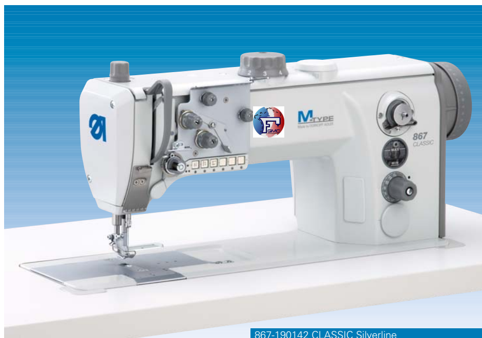
867-190142 CLASSIC Silverline

867-190142 CLASSIC Silverline La machine à base plate, point noué et une aiguille avec entraînement triple est équipée d'un lève-pied automatique, d'une course d'élévation réglable par roue de réglage, des points d'arrêts automatiques, d'un coupe-fil et d'un gros crochet type XXL à axe vertical. Grâce à la canette dont la capacité a été augmentée de 70%, le nombre des changements de canette se réduit presque de moitié.